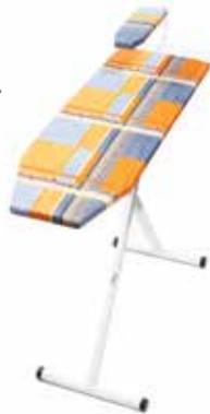
TABLA DE PLANCHAR