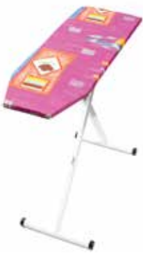
TABLA DE PLANCHAR